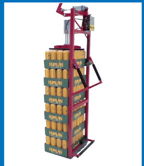
Tray- und Stapelhantierung