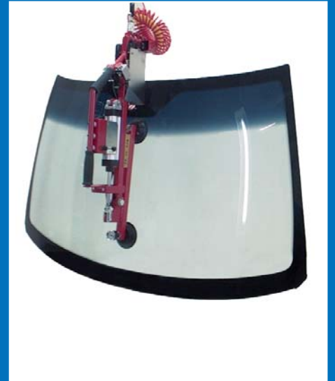
Montagetechnik (z.B. Windschutzscheiben)